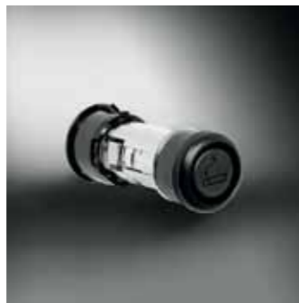
2.2 Прикуриватель 39400-59J10-000