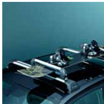
4.5 Устройство для крепления лыж 3 Для перевозки 4 пар лыж или 2 сноубордов 99000-990YT-106