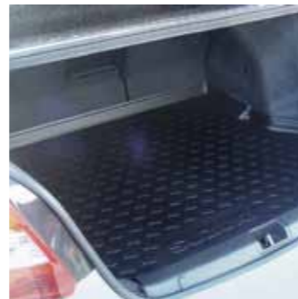
2.8 Поддон багажника Водонепроницаемый, выполнен по форме багажника с высокими бортами 990E0-57L16-000