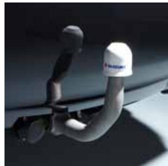
4.1 Демонтируемый фаркоп 1,2 Набор электрокомпонентов заказывается отдельно 990E0-57L00-000