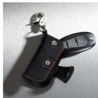
2.10 Чехол для ключа-брелка Цвет черный, натуральная кожа 99000-990X6-A11