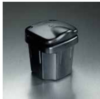
2.1 Пепельница 89810-86G10-5PK