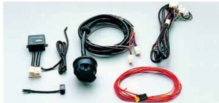
4.3 Набор электрокомпонентов Разъем для 13-контактного соединения с индикацией поворотников прицепа 990E0-57L01-000