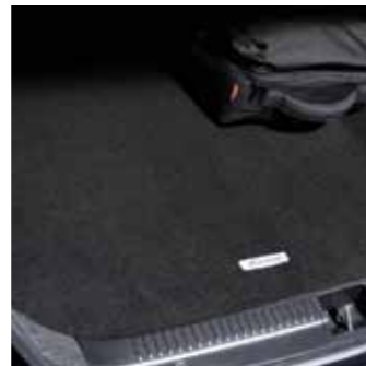
2.7 Коврик багажника Антрацитовый текстильный коврик с логотипом Kizashi 99000-99071-KT2