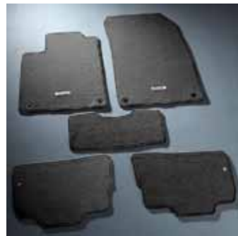
2.5 Набор текстильных ковриков в салон Набор из 5 черных ковриков с логотипом Kizashi 75901-57LB1-PM3