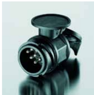
4.2 Адаптер Для подключения 13-контактной вилки к 7-контактному разъему 990E0-79J67-000