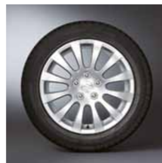
1.1 Легкосплавные диски 7 x 17 1 Дизайн с 12 спицами для шин 215 / 55 R17 94W 43210-57L10-ZRD

Свобода открывать для себя новые горизонты и неисследованные возможности. Kizashi всегда опережает Ваши ожидания. С ним Вы способны на большее. Нет более простого способа сделать облик Вашего автомобиля еще более изысканным, чем великолепные легкосплавные диски. Дорога никогда не будет Вам в тягость.