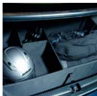
4.8 Складывающийся ящик в багажник Отлично подходит для размещения вещей в багажнике 99000-990W9-A01