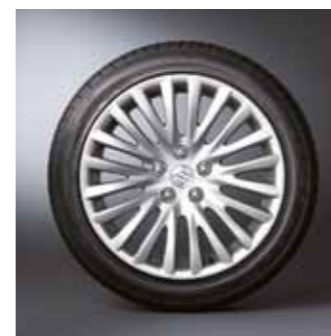
1.2 Легкосплавные диски 8 x 18 1 Дизайн с 20 спицами, для шин 235 / 45 R18 94W 43210-57L20-ZNP