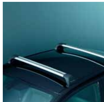
4.4 Багажник на крышу 3 Алюминиевый профиль с Т-образным креплением 990E0-57L33-000