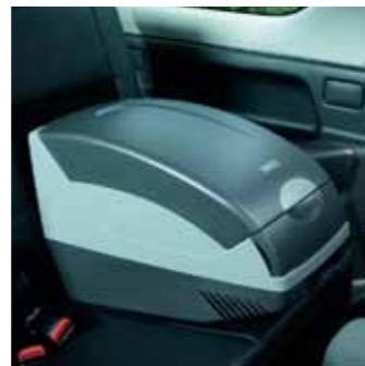
2.3 Автохолодильник Объем — 15 л, фиксируется с помощью ремня безопасности 990E0-64J30-000