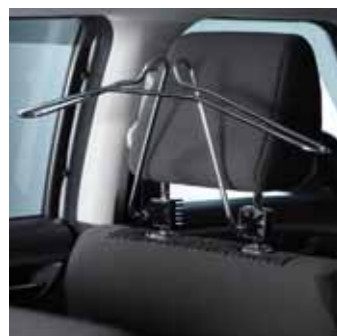
2.9 Вешалка для одежды С креплением к подголовнику переднего сиденья 990E0-79J89-000