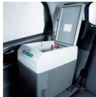
2.4 Автохолодильник Объем — 21 л, фиксируется с помощью креплений типа ISOFIX 990E0-64J23-000