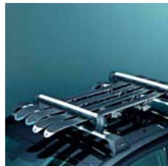
4.6 Устройство для крепления лыж 3 Для перевозки 6 пар лыж или 4 сноубордов 99000-990YT-107