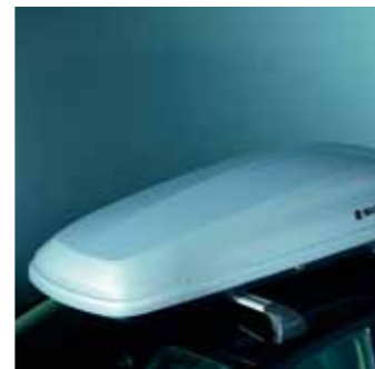
4.7 Бокс на крышу 3 Объем 440 л, 233x82x42 см 990E0-59J43-000