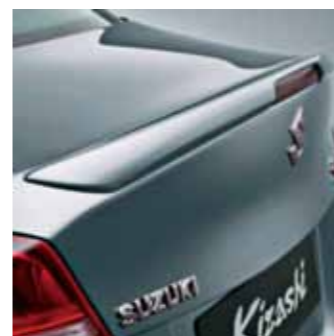
1.5 Спойлер на крышку багажника С дублирующим стоп-сигналом и облегчающим открывание багажника торсионным механизмом с грунтованными петлями 99000-99094-K01