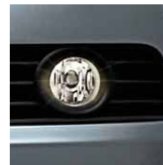
1.6 Комплект противотуманных фар 2 35500-57810-000