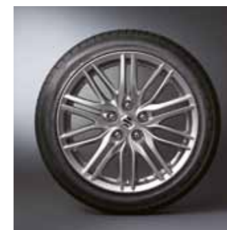
1.3 Легкосплавные диски 8 x 18 1 Дизайн с 20 спицами, для шин 235 / 45 R18 94W 43210-58L00-ZRH