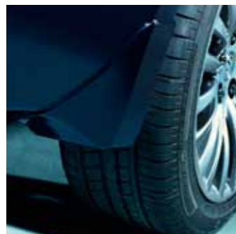
3.1 Комплект брызговиков Набор из 4 жестких брызговиков (передние+задние), могут быть окрашены в цвет кузова 72201-57L00-5PK

Повседневная жизнь приносит неожиданные и не всегда приятные сюрпризы. Комфортное и уютное детское автокресло обеспечит максимальную безопасность для ребёнка в дороге. Надёжное автомобильное кресло для малыша – это залог Вашего спокойствия. А комплект брызговиков не только надёжно защитит Ваш автомобиль от грязи и пыли, но и станет отличным дополнением к уникальному дизайну Вашего Suzuki Kizashi.